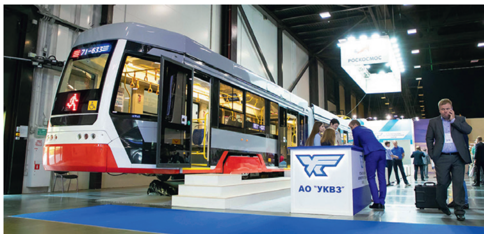
Трамвай 71-633 («Челябинский метеор»)

Также Горэлектротранс подписал соглашения с АО «Стройтранс» – об испытаниях вологодского электробуса Sirius, с ОАО «Уралтрансмаш» – об испытаниях низкопольного трамвая модели 71-415. Соглашение с ООО «Лиотех Инновации» предусматривает совместную работу по разработке и испытаниям современных образцов литиевых тяговых батарей.