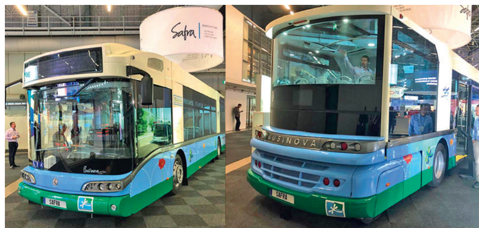
Пример технологии безвыбросного транспорта: общественный транспорт на водородном топливе